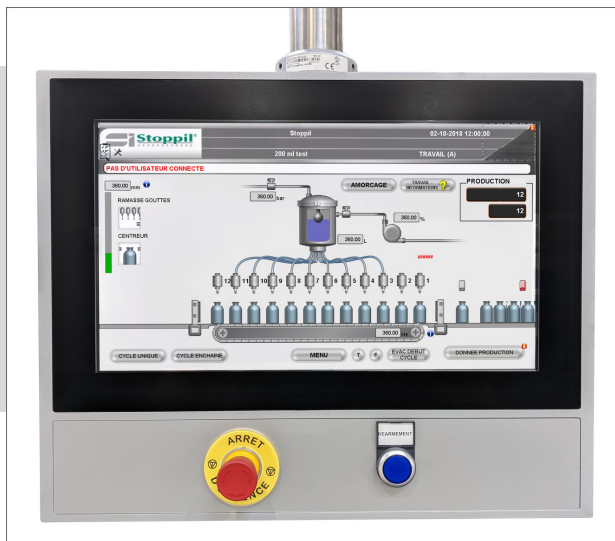
Ecran tactile couleur 15"