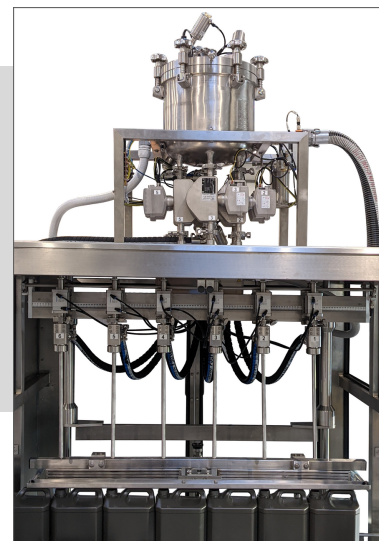
Becs de remplissage